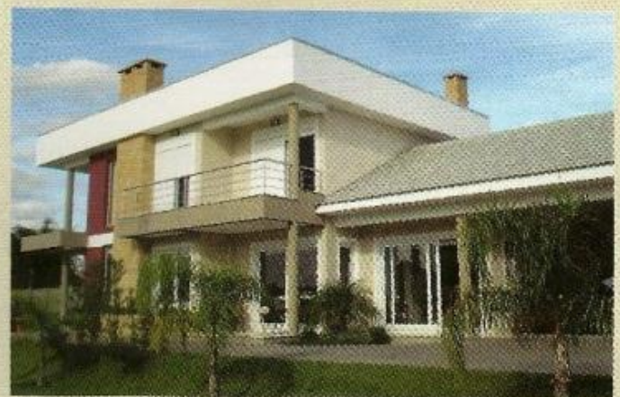
Imagens das principais etapas do trabalho realizado para Clóvis Kras - projeto, obras, casa finalizada